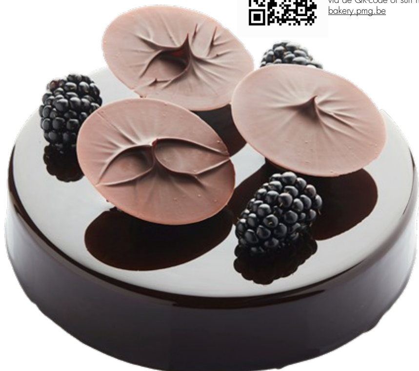
BLAQ is een originele creatie van Frank Haasnoot

via de QR-code of surf naar bakery.pmg.be